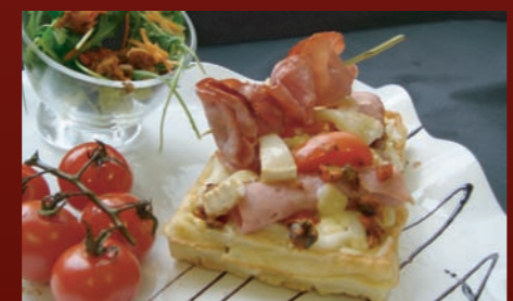
Le croque gauffre