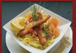
Tagliatelles aux 2 saumons